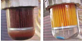
ストレーナー洗浄前(左)、洗浄後(右) ※上記画像はストレーナー交換した場合です。